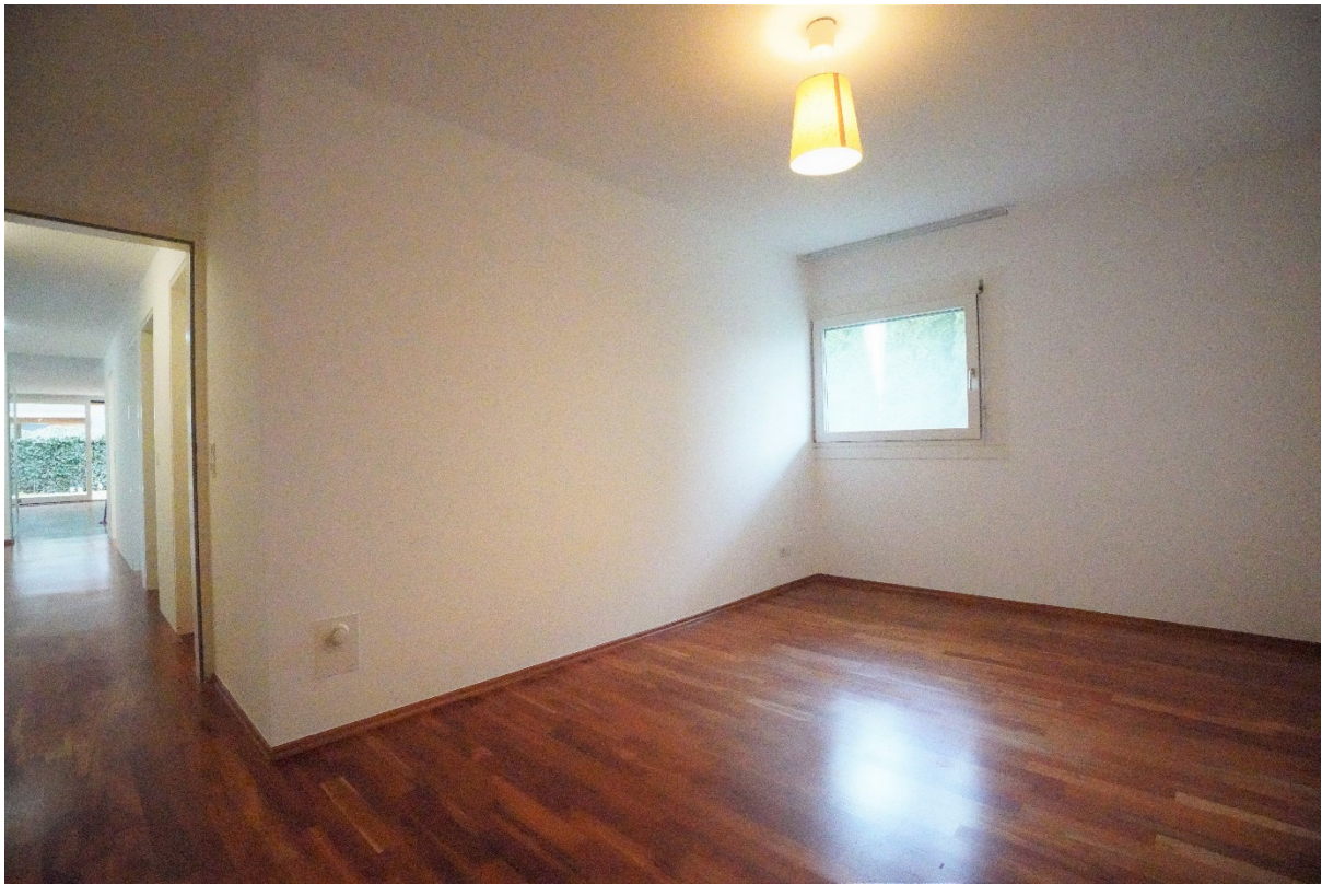
Kinderzimmer / Büro 1: