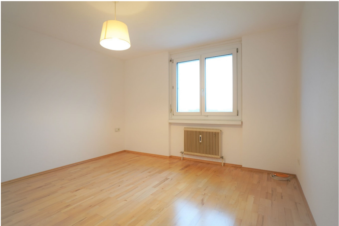
Kinderzimmer1 / Büro1: