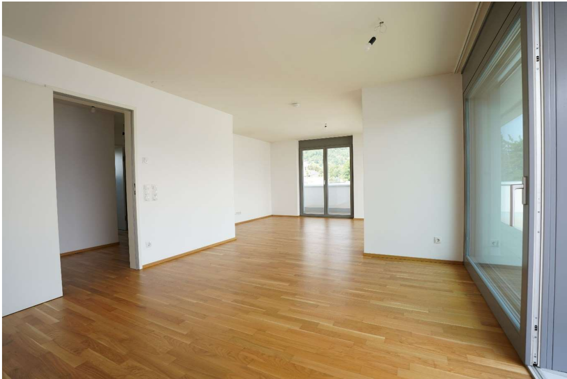
Küche / Essbereich: