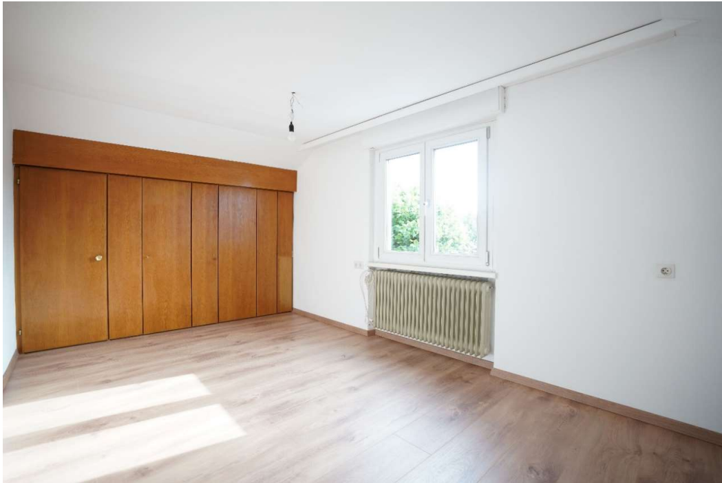
Kinderzimmer2 / Büro2: