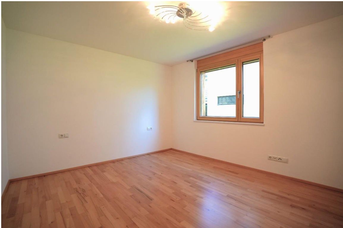
Kinderzimmer / Büro: